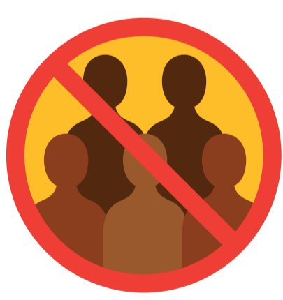
PAS DE PETITS GROUPES