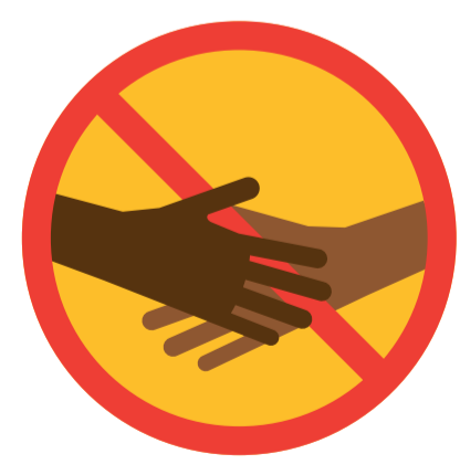
SALAAM «SANS CONTACT»