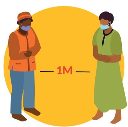
GARDER SES DISTANCES