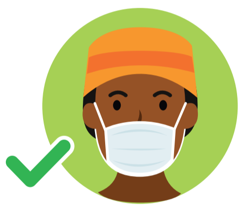
PORT DU MASQUE OBLIGATOIRE