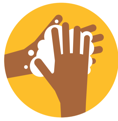
LAVAGE DES MAINS OBLIGATOIRE