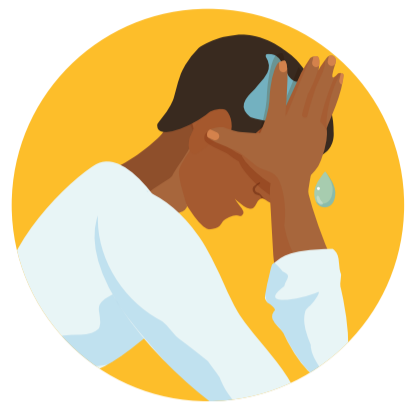
ABLUTIONS (WOUDHOU) À LA MAISON